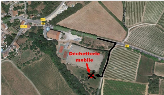
- Plan d'accès déchetterie

La déchetterie sera stationnée à son nouvel emplacement ; derrière le stade, près des terrains de tennis. ( voir plan ci-dessous)